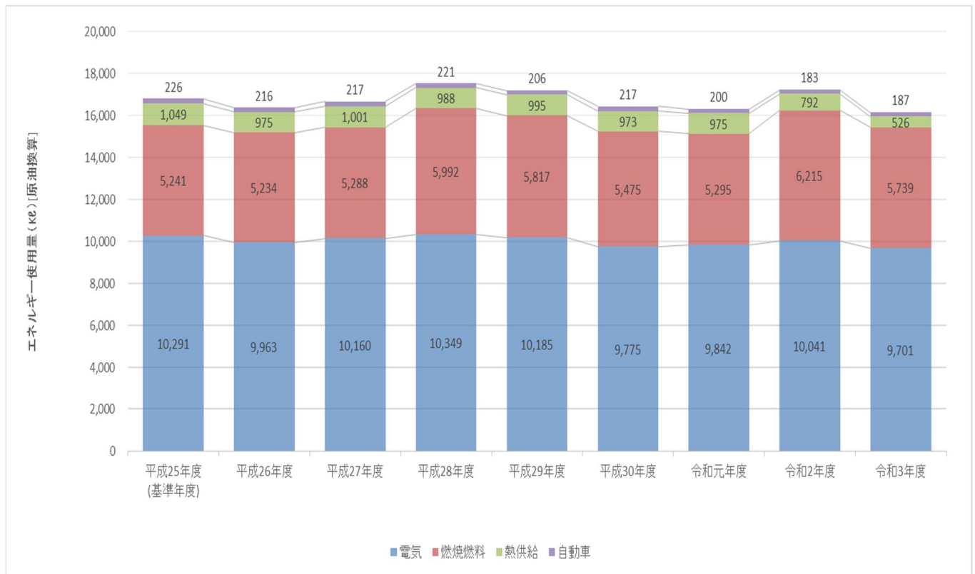
図2 エネルギー使用量（原油換算）の推移